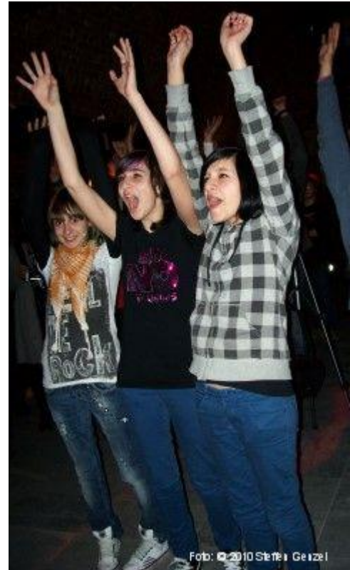
Stimmung pur! Unsere Fans...

Erster Bandauftritt (als DYING ROMANCE) war zum Tag der offenen Tür an unserer Schule am 27. Februar.